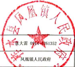
绩效运行监控表 (2024年度)