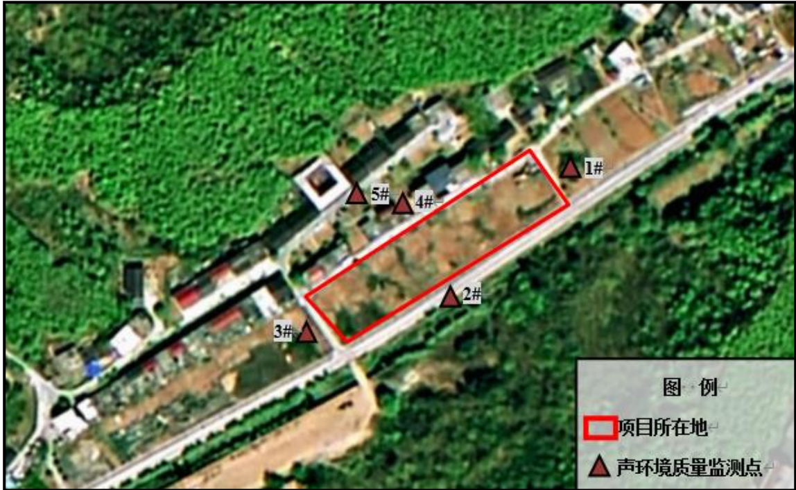
图 3-1 声环境质量现状监测点位图

根据监测结果，项目各厂界和沙坪村的昼夜间监测值均满足《声环境质量标准》（GB3096-2008）中的 2 类区标准要求，项目所在地声环境质量状况良好。